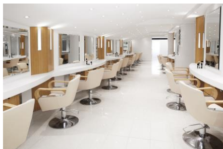
Salon de coiffure – Flagship

« Notre volonté a été d'engager nos marques et réseaux de coiffure dans une démarche ambitieuse de développement durable. Notre activité repose en grande partie sur l'implication et le dynamisme de nos réseaux de franchises et toutes les études menées ont montré par ailleurs qu'ils généraient la majeure partie de notre empreinte environnementale. Il nous est donc paru primordial de mettre à leur disposition un outil leur permettant à la fois de comprendre les enjeux environnementaux en salon et d'agir pour les réduire. Notre objectif est basé sur l'implication de 100% de nos salons français d'ici à 2020. »