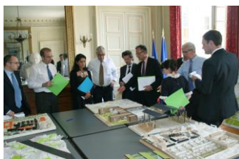
Présentation des maquettes