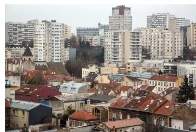
Bagnolet - 2015