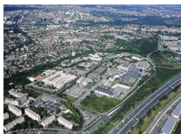
Bry-sur-Marne - 2013