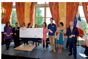
Remise des prix