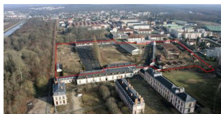
Fontainebleau - 2011

Ergapolis a souhaité accompagner les jeunes diplômés et les futurs créateurs de villes durables dans leur accès à l'emploi. C'est dans cet esprit qu'est né « l'incubateur Ergapolis ». Complémentaire du concours, il s'agit d'une plateforme d'insertion professionnelle qui permet aux jeunes de conserver la pratique interdisciplinaire tout en leur offrant les meilleures conditions de devenir entrepreneurs, de développer des liens privilégiés avec de futurs donneurs d'ordre ou de rencontrer leurs futurs employeurs.