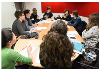
Séance de travail