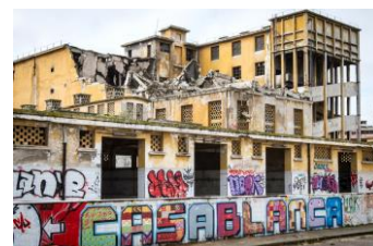
Casablanca - 2013