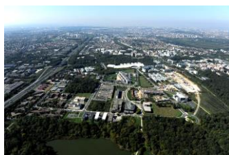
Noisy-Champs - 2012