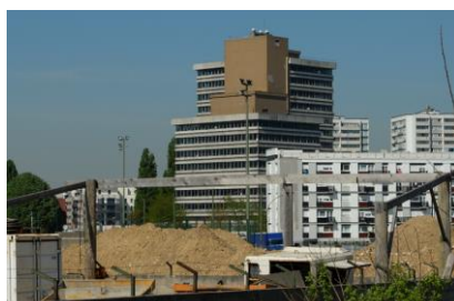
Clichy-sous-Bois et Montfermeil 2014